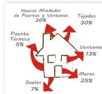
Pérdidas energéticas en el Edificio

Renueve su edificio y disminuya los gastos de mantenimiento futuros.